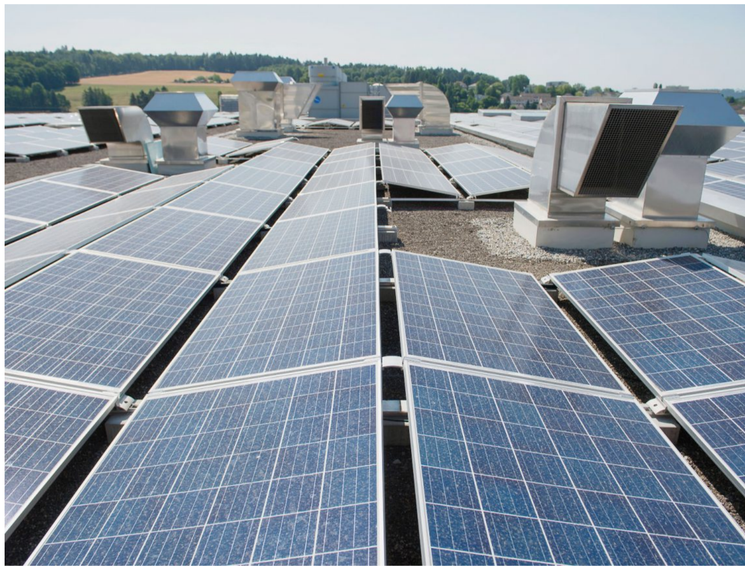
Das Thema Solarenergie ist präsent in Biel: Die Solaranlage auf dem Dach der Tissot Arena.

Denn im Vergleich zu anderen Gemeinden ist die Stadt Biel